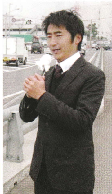
連日駅頭・街頭にて訴えています