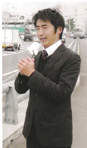
連日駅頭・街頭にて訴えています