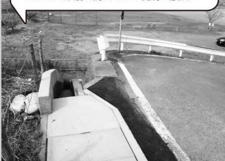
上豊岡運動広場入り口における雨水流入による土砂崩れ防止のため側溝を敷設。