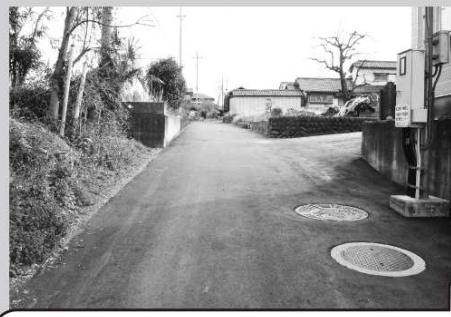
引間地区において下水道工事後の仮舗装の復旧および、豪雨時の住宅への浸水対策のため排水溝を設置