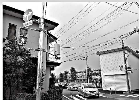
六郷小学校前東側交差点に歩行者用信号を設置。子ども達の安全を確保。