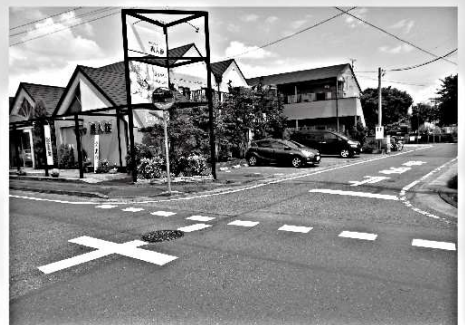
環状線「とりせん」の交差点を北に進んだ「異人館」横の交差点で事故が多発するため、「止まれ」表示の引き直し・強調を行った。