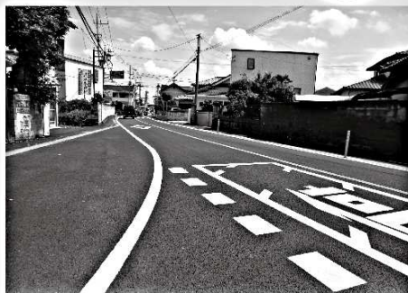
環状線「下小島西」交差点から北に行く県道の歩道の改良工事に着手。長年の懸案事項が前進