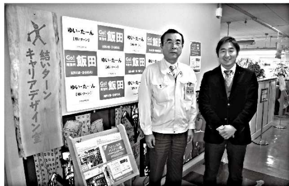
H24年度一般質問にて、長野県飯田市の「結いターン事業(※)」をもとに若者流出防止策を提言。「Gターン事業」という形で群馬でも取り組みが本格化！

H25年度は 2415人も流出！ 若者流出を食い止める 「Gターン事業」がスタート！