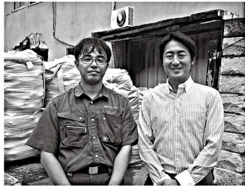
原材料高を逆手に！ペットボトルキャップなどから再生原料を生産する企業を訪問調査。